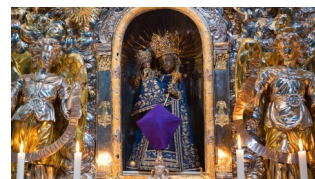
Die Schwarze Madonna