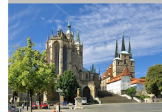
Dom und St. Severin Kirche in Erfurt