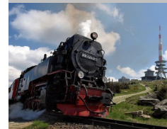
Harzer Bahn mit Brocken