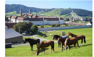
Marstall Kloster Einsiedeln

Lernen Sie die spannende Geschichte der Einsiedler Pferdezucht an dem Ort kennen, wo sie seit 1000 Jahren zu Hause ist. Wir stellen Ihnen unsere typvollen Pferde vor und zeigen Ihnen die originalen Stallungen, sowie die moderne Pferdehaltung.