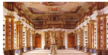
Museum Benediktinerabtei Ottobeuren